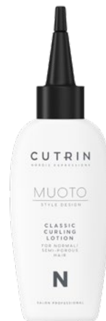
MUOTO Classic Curling Lotion N normaaleille/hiukan huukoille hiuksille