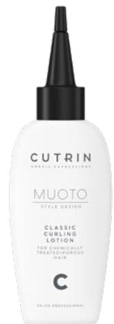
MUOTO Classic Curling Lotion C käsitellyille/huukoille hiuksille