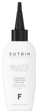
MUOTO Classic Curling Lotion F normaaleille/vaikeasti kihartuville hiuksille

Kiinnitys tehdään hiustyypille sopivalla CUTRIN MUOTO -kiinnitteellä noudattaen kyseisen tuotteen käyttöohjetta. Hiukset huuhdellaan huolellisesti ja käsitellään lopuksi hiustyypille soveltuvalla poishuuhdottavalla CUTRIN -hoitoaineella.